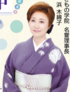
典雅きもの学院 名管理事長 女優 浜木綿子

*入会プレゼントは12回以上のコースが 対象です。授業料一括前納の方に限ります。