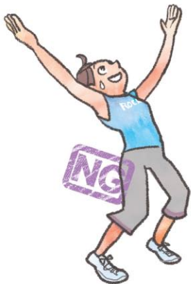
イラスト フカ田サトミ

下のイラストのように、背中や腰をそり、天を仰いでしまっている人が多いです。おなかを出さないようにして、胸をそらせましょう。